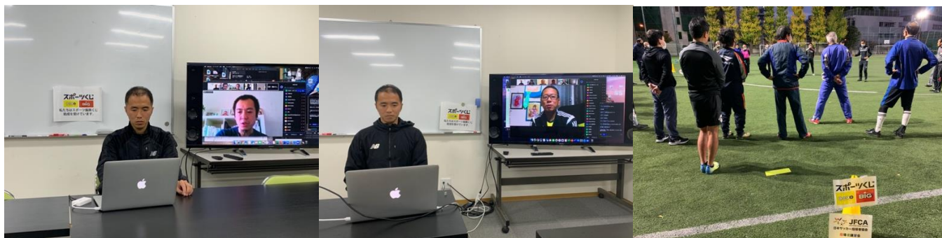
11月6日 オンラインセミナー