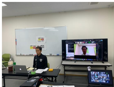
9月26日 オンラインセミナー